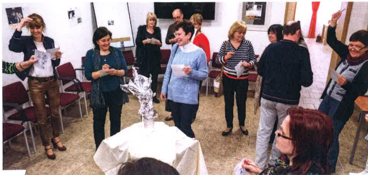
Vzdělávací setkání ředitelů škol se konalo v Rožmitále pod Třemšínem